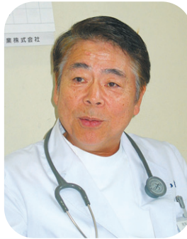
西村内科脳神経外科病院